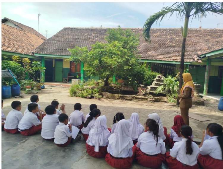
Gambar 2. Kegiatan Pembelajaran Siklus 1